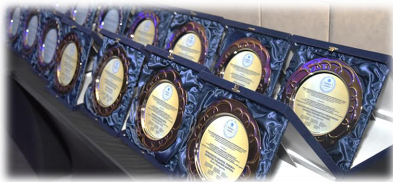
Nagrade i priznanja „Globallocal“

dodjeljuju se tradicionalno od 2019. godine