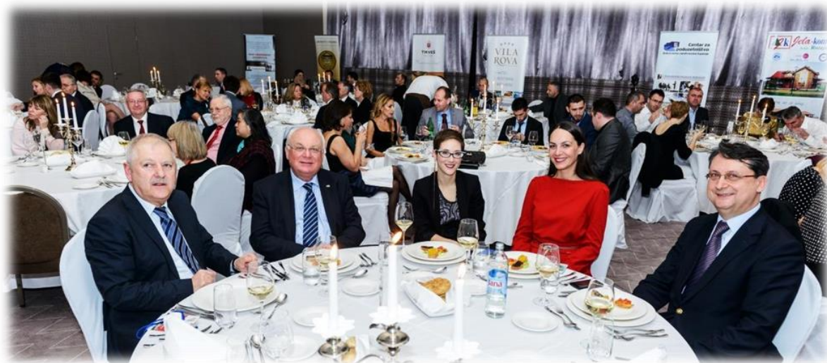
Topla i prijateljska atmosfera na Gala večeri idealno je mjesto za dodatna druženja i razgovore