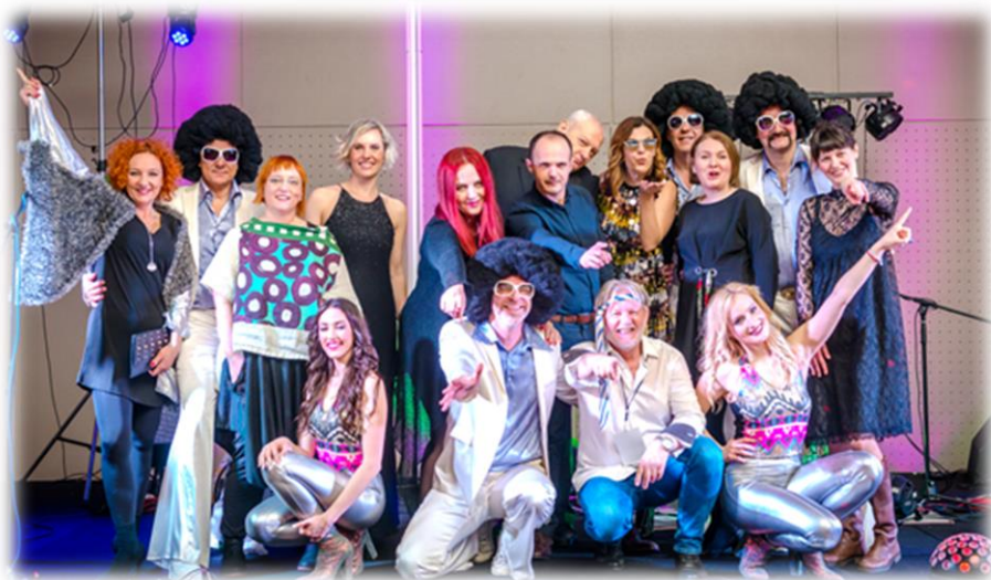
Profesionalno kreirani program, dobar izbor izvođača i raspoloženi gosti - sudionici, uvijek garantiraju dobru atmosferu, zabavu i druženje...