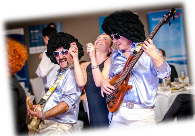
Na Gala večeri tradicionalno se vrši izbor Najelegantnije dame i Najrasplesanijeg para...