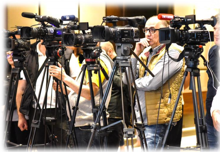
Svjetskom kongresu poduzetnika u Skoplju (S. Makedonija), 2019. godine